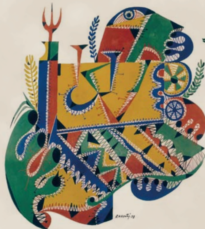
Rafael Alberti: 1º Congreso de la Confederación Sindical de CCOO 1978, 63x90 cm.

Centro Cultural Alcazaba. Ayuntamiento de Mérida, 23 de mayo - 26 de junio 2008 (C/ John Lennon, 5)