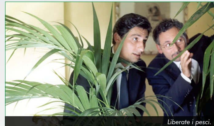
Liberate i pesci.