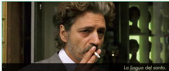
La lingua del santo.

Intérpretes: Antonio Albanese, Fabrizio Bentivoglio, Toni Bertorelli