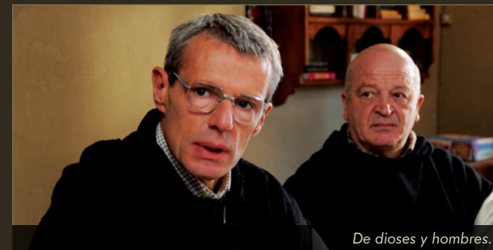
De dioses y hombres.

Intérpretes: Lambert Wilson, Michael Lonsdale, Olivier Rabourdin