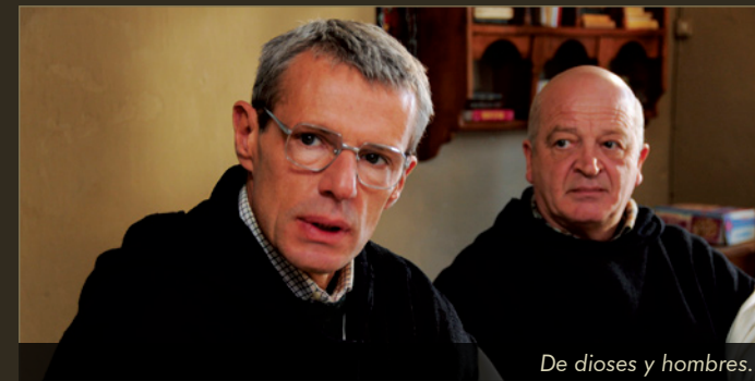
De dioses y hombres.

Intérpretes: Lambert Wilson, Michael Lonsdale, Olivier Rabourdin